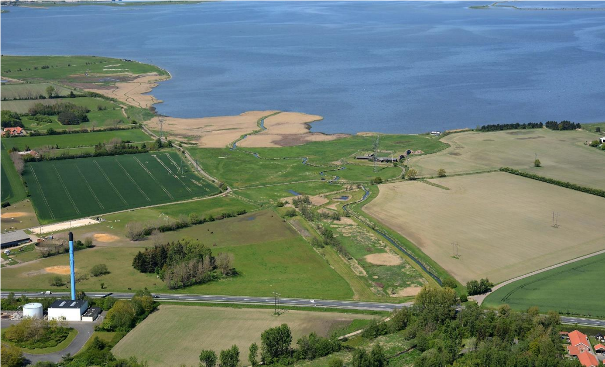
Figur 2: Udover Odense Å udmunder flere vandløb i Odense Fjord. Her Vejrup Å omkranset af de tilbageværende engområder.

Hele Odense Fjord er udlagt som vildtreservat med forbud mod jagt fra motorbåd. Desuden er der forbud mod færdsel i den inderste del af Egensedybet og den sydlige del af Vigelsø samt færdselsforbud på og omkring en række småøer i fuglenes yngletid.