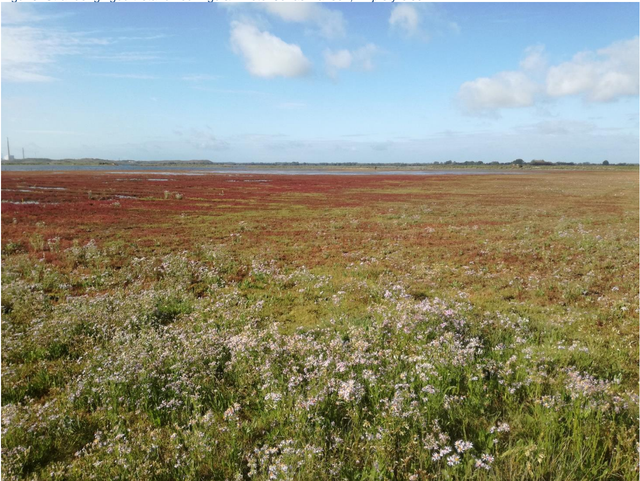
Figur 9: Strandeng i god tilstand ved Vigelsø.

Der kan være indsatser i Natura 2000-planens indsatsprogram, hvor der ikke er samme klare geografiske afgrænsning. I denne handleplan er der en naturlig ansvarsfordeling ud fra den geografiske afgrænsning, og dermed hvilken myndighed, der er ansvarlig for gennemførelse.