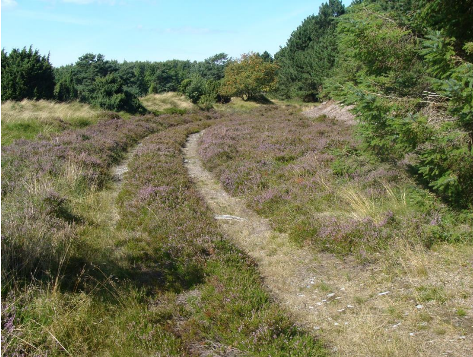
Figur 8: Hedeområde ved Enebærrodde: Foto Kurt Due Johansen.