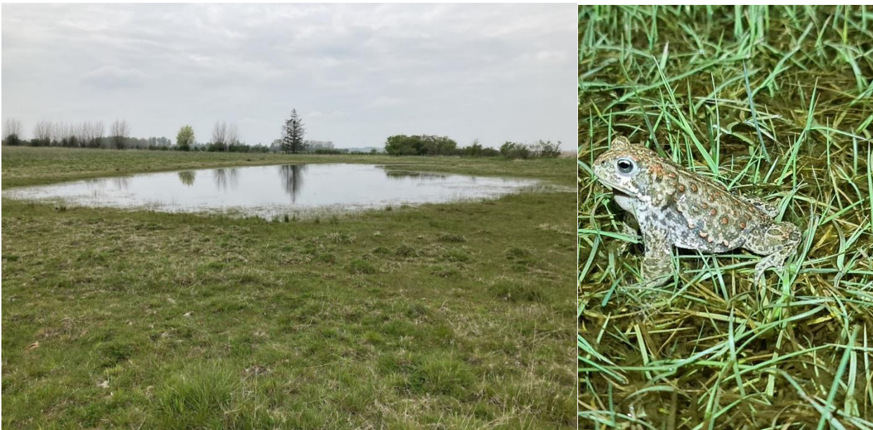
Figur 6: Der er etableret midlertidigt vandfyldte lavninger med henblik på at forbedre området som levested for bl.a. engfugle og strandtudse.

* Omfatter ikke offentlige arealer, hvor ejeren gennemfører Natura 2000-planen i egne planer for forvaltningsindsatser. Se resumé af plan for forvaltningsindsatserne i bilag 1.