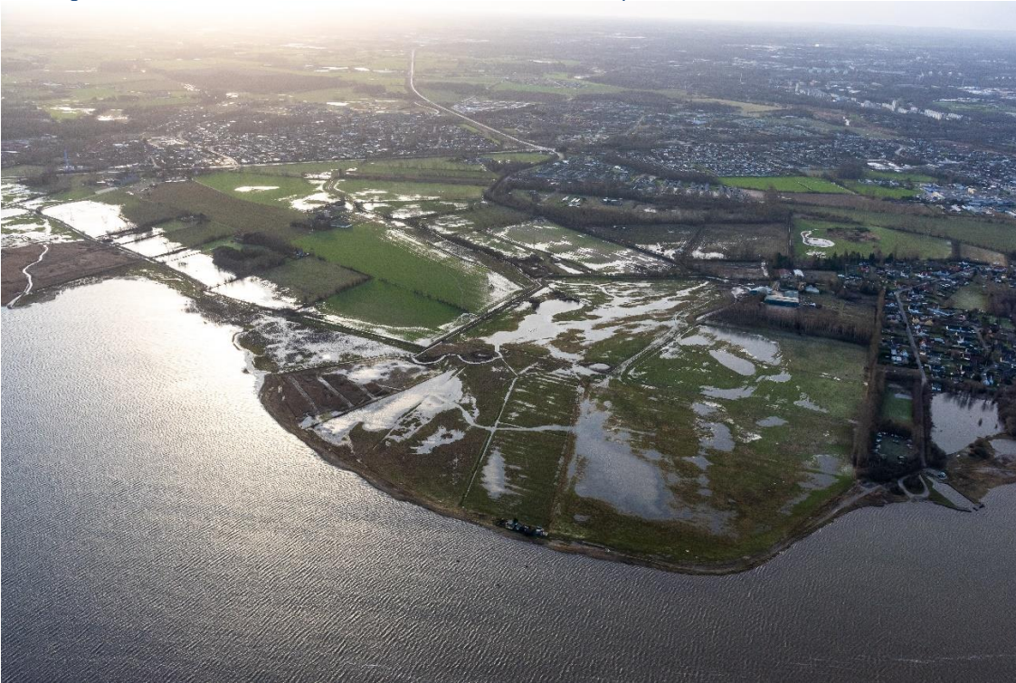
Figur 7: Genopretning af naturlig hydrologi og kystdynamik eks. ved tilbagetrækning af kystdiger ved Seden Strandby. Foto taget efter stormen "Pia" den 22. december 2023.

Skovbevoksede, fredskovspligtige arealer følger en 12 års-cyklus, og første planperiode for disse løber således fra 2010 til 2021. Tabel 3 neden for viser status for de gennemførte eller igangværende indsatser i perioden 2010-2021 beliggende i kortlagt habitatskov inden for Natura 2000-området. Indsatserne er opgjort på indsatstype. Der kan være gennemført flere indsatser på det samme areal, hvorved samme areal kan fremgå flere gange (eksempelvis skovnaturtypebevarende drift og pleje forud for urørt skov, eller forbedring af hydrologi på samme areal, hvor der også er udført skovnaturtypebevarende drift og pleje). Indsatsplanerne for arealerne blev først udgivet i skovhandleplanerne i 2012.