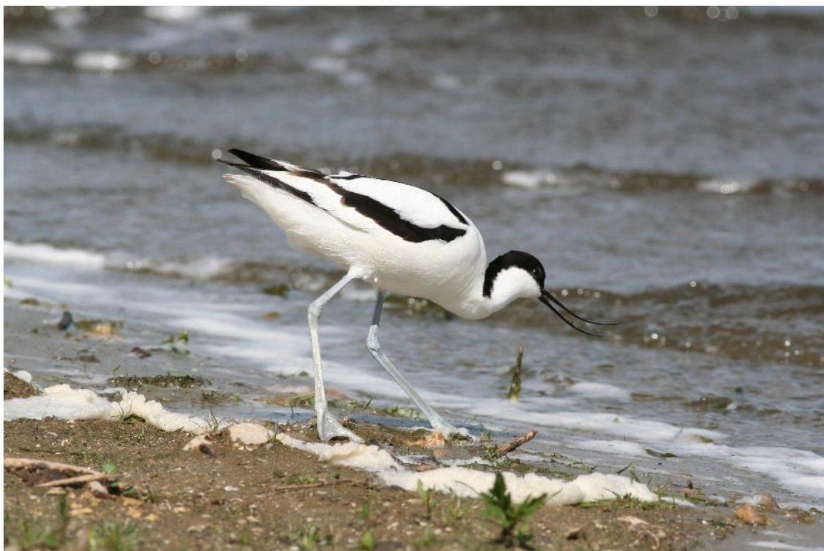
Figur 3: Natura 2000-området er bl.a. udpeget på baggrund af områdets betydning for Klyde.