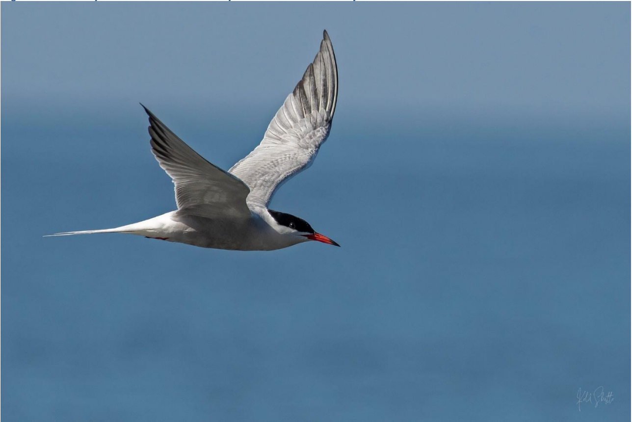
Figur 1: Odense Fjord er bl.a. levested for Fjordterne.