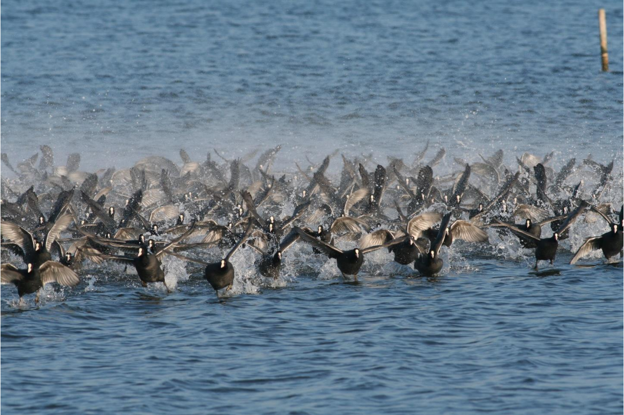
Figur 5: Blishøns overvintrer i stort antal ved Odense Fjord.