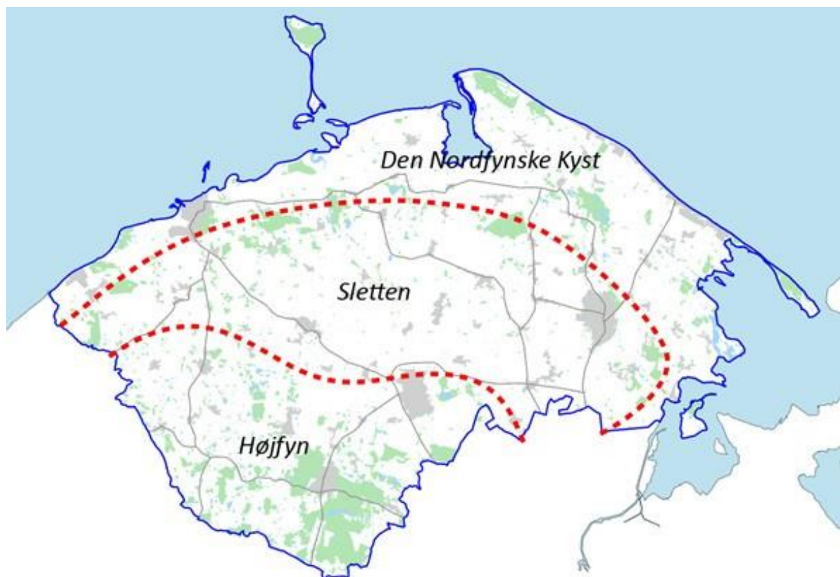
Højfyn, Sletten og Den Nordfynske Kyst

Der er i udpegningen af særligt bevaringsværdige kulturmiljøer lagt vægt på især at medtage miljøer, som ikke allerede er omfattet af beskyttelse gennem anden lovgivning, som for eksempel fredninger, §3-områder, Natura 2000 udpegninger m.v.