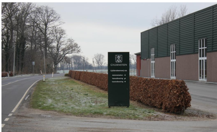
Eksempel på reklameskilt i det åbne land

Eksempler på arrangementer, hvor lejlighedsskiltning kan tillades: