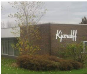
Eksempel på facade-skilt i erhvervsområde