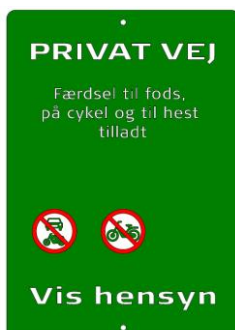
Godkendt skilt fra Naturstyrelsen

Derfor skal skilt med "Privat vej" suppleres med et tydeligt under-skilt, hvor det fremgår, at vejen er åben for færdsel til fods og på cykel. Kun i særlige tilfælde og når der f.eks. holdes jagt, eller der foregår særlige erhvervs-mæssige aktiviteter, der kan være til fare for forbipasserende, kan underskiltet fjernes.