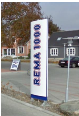
Eksempel på pylon ved indkørsel