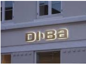
Eksempel på indvendig belyst skilt