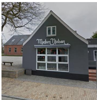
Eksempel på facadeskilt, malet direkte på gavlfacade mod vei.

Bebyggelse i byzone eller samlet bebyggelse i landzone