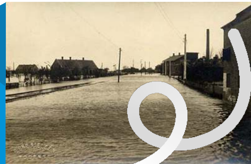
Oversvømmelsen i Bogense i vinteren 1921 satte mange boliger under vand.