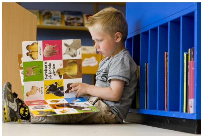
På et bibliotek kan man ikke kun læse bøger

Nordfyns Kommune er allerede medlem af Film Fyn. Der skal fremover gøres en særlig indsats for filmproduktioner i kommunen. Vi hjælper produktionsselskaberne hurtigere og mere smidigt igennem det offentlige system, der skal søges godkendelser, tilladelser, arbejdskraft mv.