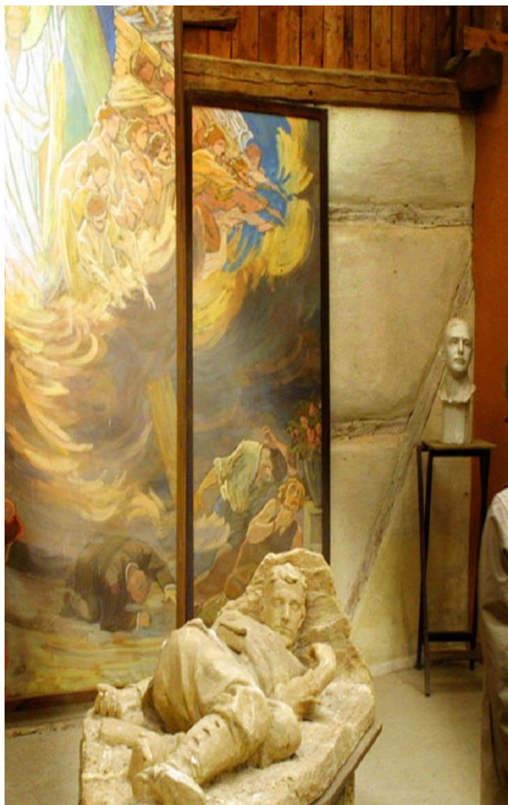
Skitsemuseum ved Hofmangave

Visionen skal opnås ved at arbejde med de indsatsområder, der er beskrevet nedenunder.